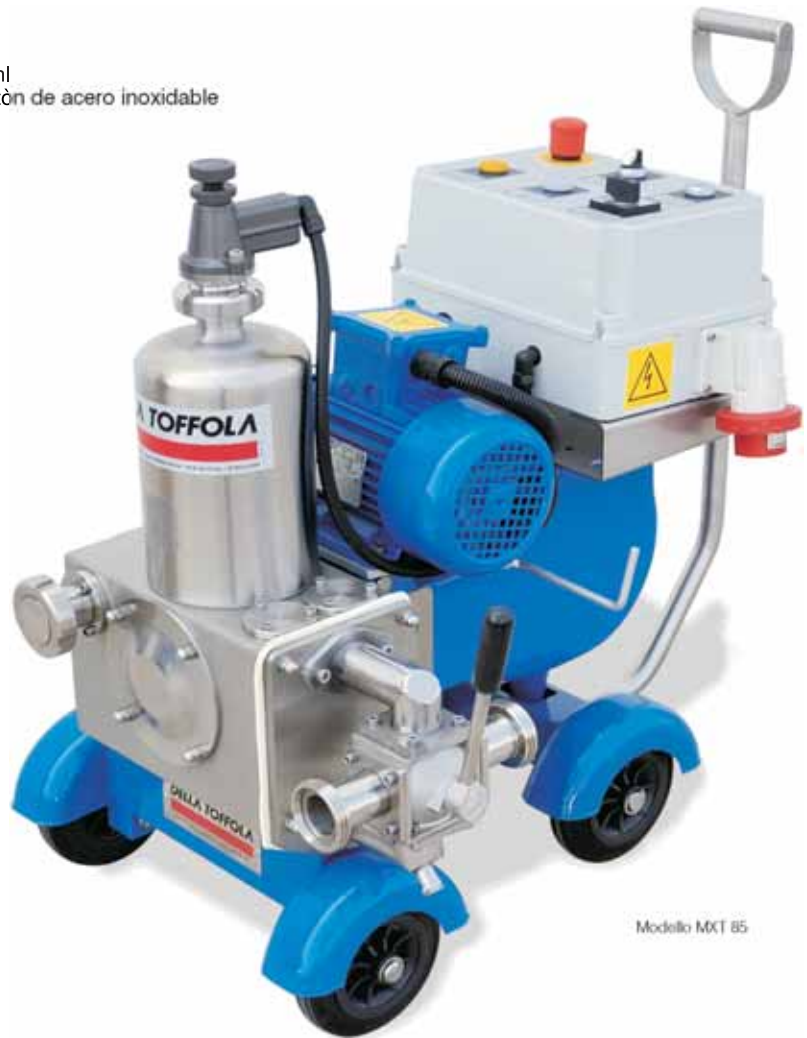
Modello MXT 85

Based on fifty years of experience in the wine-making sector, a vast range of advanced technology stainless steel piston pumps that feature a high level of efficiency, sturdiness, and reliability. Maintaining the fundamental "long stroke" characteristic, these pumps make it possible to obtain a high yield, even with the most difficult liquids, as well as flow that is regular, balanced, and smooth.