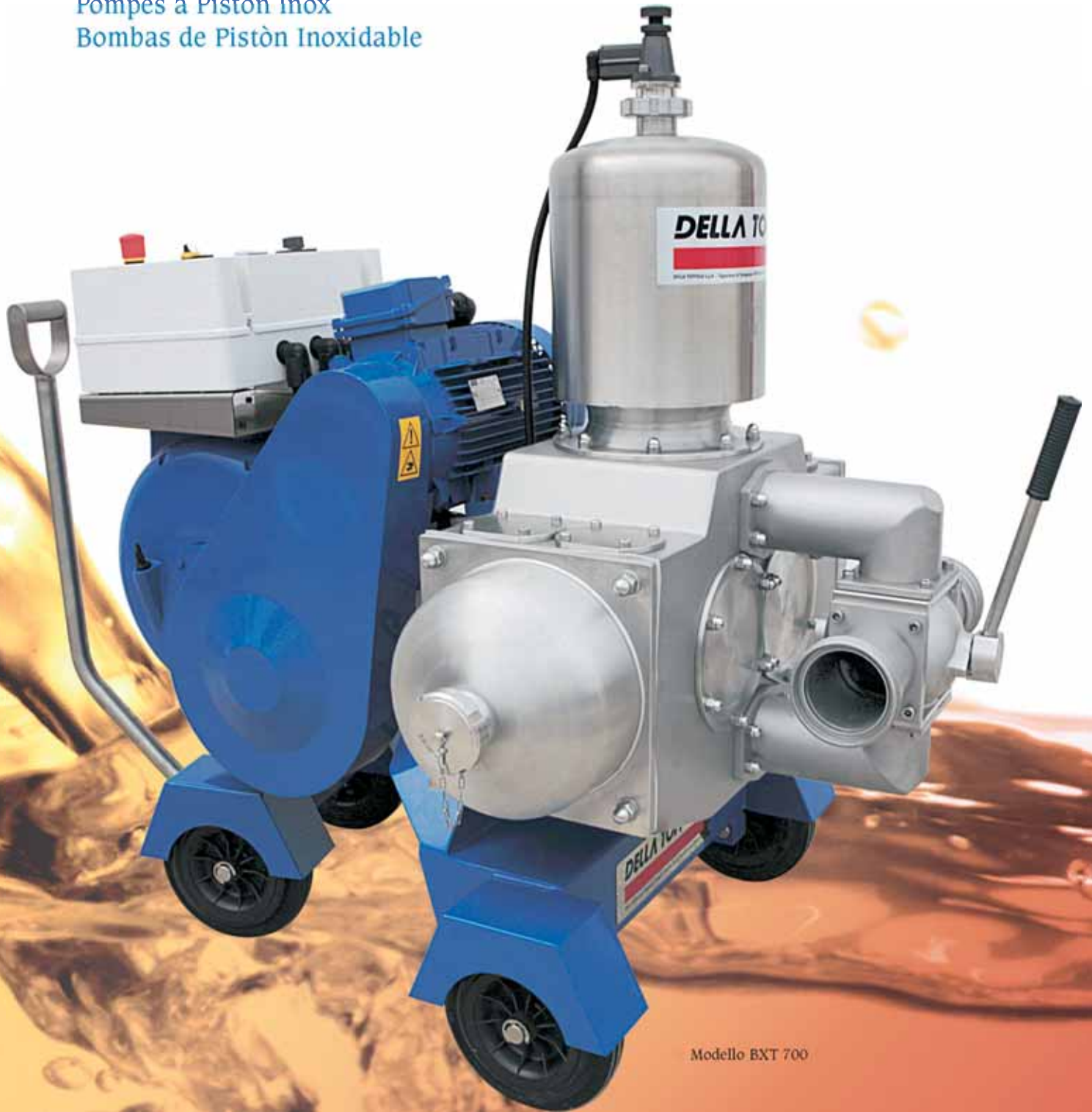
Modello BXT 700

Stainless Steel Piston Pumps Kolbenpumpen Aus Edelstahl Pompes à Piston Inox Bombas de Pistòn Inoxidable