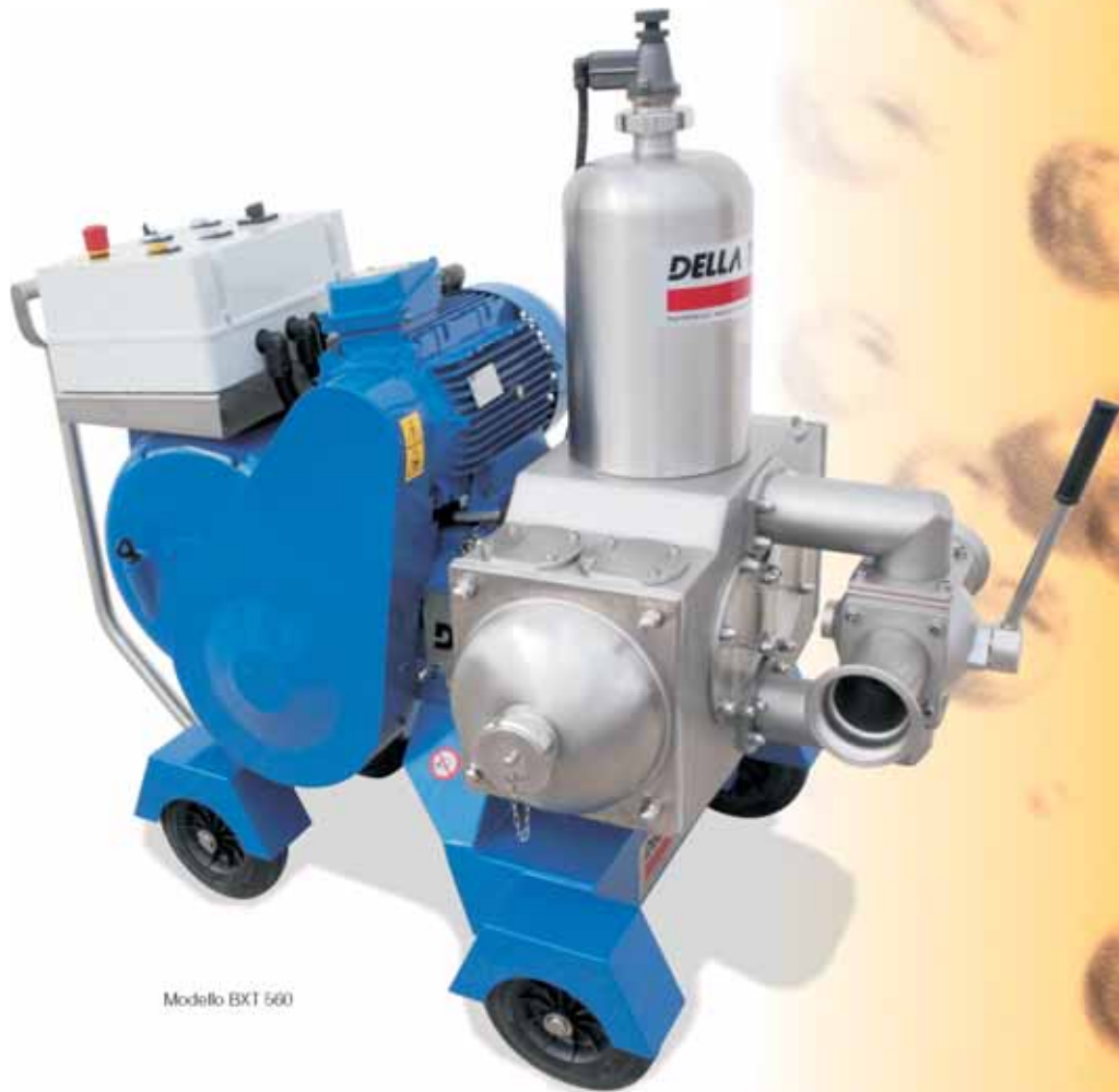
Modello BXT 560